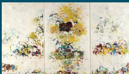
Sin título, Joan Mitchell, triptico, 1969

Portada: Margarita de Austria, detalle de un vitral del ábside. Diseño gráfico: Emmanuel Labard, Coralie Millière/Designers Unit. Imprimé en France, 2019.