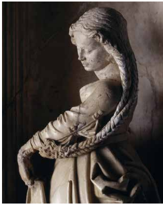
Sibila Agrippa, sepulcro de Filiberto el Hermoso

El sepulcro de Margarita de Austria, con su baldaquino de piedra decorado con estatuillas de santos y santas, evoca los sepulcros reales. En la parte superior se lee el lema de la princesa: Fortune Infortune Fort Une (El destino abruma mucho a una mujer).