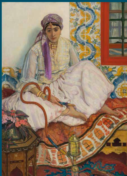
Mujer con margaule, Jules Mignonney

63 boulevard de Brou 01000 Bourg-en-Bresse Tél. 04 74 22 83 83 brou@bourgenbresse.fr www.monastere-de-brou.fr