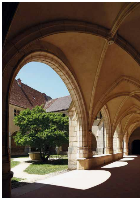
Claustro de los huéspedes

La nave , abovedada con ojivas y flanqueada por naves laterales y capillas, con sus paredes desnudas, sus imponentes pilares y sus vitrales incoloros, es deliberadamente sobria, contrastando con la riqueza del coro. Los fieles solo podían entrar allí en ciertas festividades anuales.