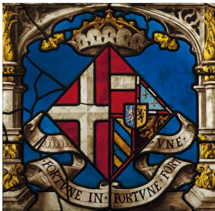
Escudo de armas de Margarita de Austria