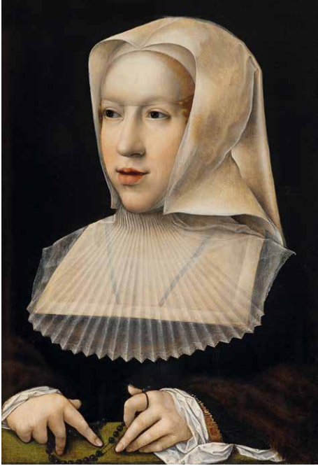
Margarita de Austria, Bernard van Orley, museo del real monasterio de Brou.