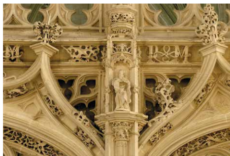
Detalle del coro alto