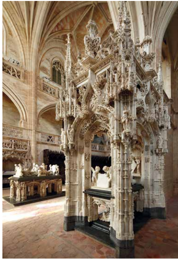
Sepulcro de Margarita de Austria y Filiberto el Hermoso

El sepulcro de Margarita de Borbón , madre de Filiberto. Esculpido en un nicho funerario en el muro sur, está rodeado por una rica y opulenta decoración. Los dolientes recuerdan a los de los sepulcros de los duques de Borgoña en Dijon. La arquitectura y las pequeñas estatuas de los tres sepulcros son obra de un taller flamenco, probablemente el del bruselense Jan Borman, y los yacientes fueron creados por el escultor de origen alemán Conrad Meit.