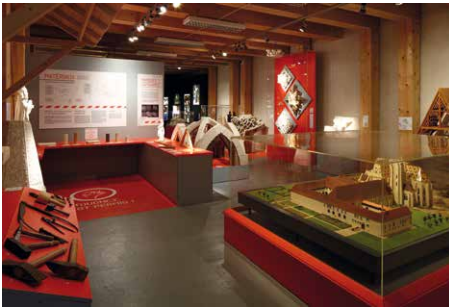
Espacio «¡Qué obra!»

La despensa acoge el espacio «¡Qué obra!», que destaca los conocimientos y la pericia de los constructores y restauradores del monumento a través de diversos oficios: maestro de obras, carpinteros, techadores, canteros, escultores y maestros vidrieros.