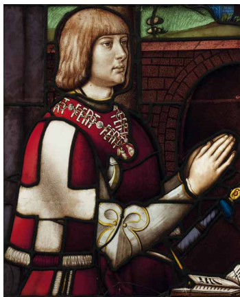
Filiberto el Hermoso