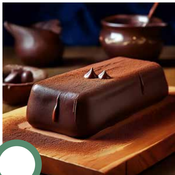
Gâteau au chocolat

Attention, une fois encore, un intrus s'est glissé dans la liste de plats !