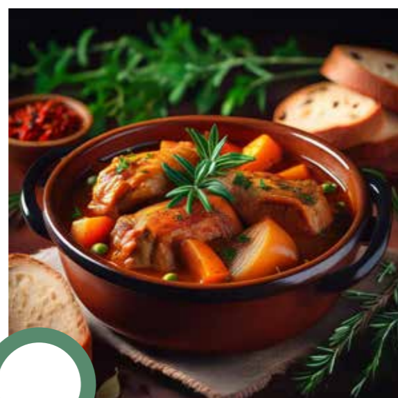
Ragout de cygne aux fines herbes