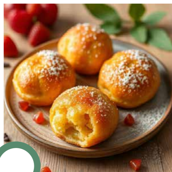
Rissoles aux fruits secs et au miel