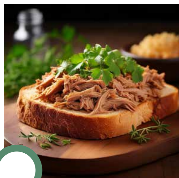
Tranchoir (tranche de pain) de porc aux herbes et à la bière