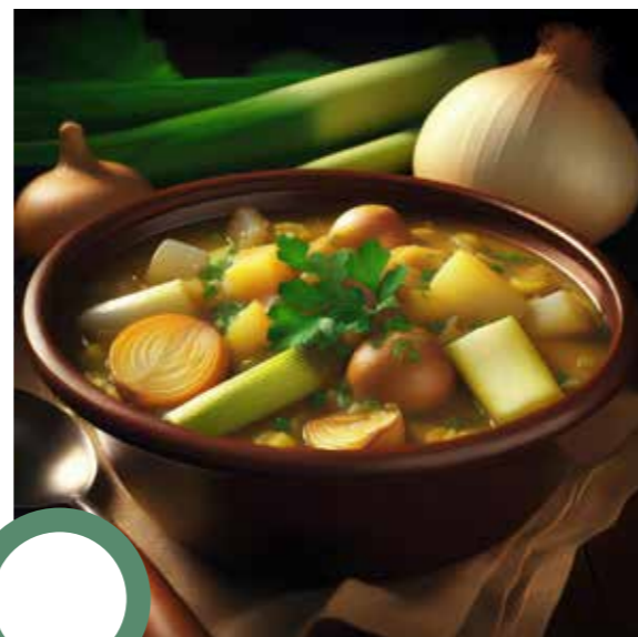
Potée de poireaux, navets et oignons