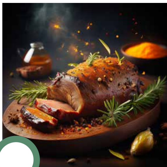
Rôti de sanglier mariné aux épices