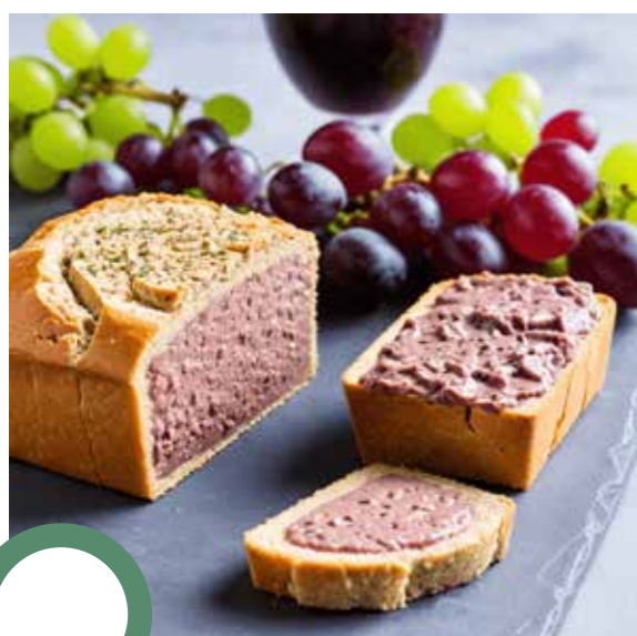
Pâté de grives aux raisins