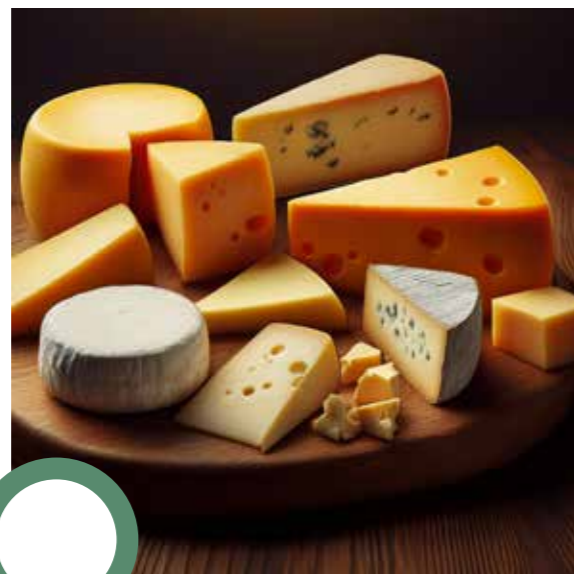
Plateau de fromages